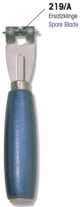
219 Fugenhobel mit 5 Klingen, einfache Ausführung Grooving Tool with 5 blades, standard type