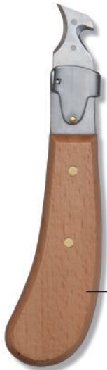
311/22 Einschneideklinge Incision Blade