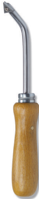
700 Dreikantschaber mit auswechselbarer Widia Klinge für Schweißjungen, ideal für Sicherheitsbeläge, mit 6 Schneiden Triangular Scraper with replaceable carbide blade for welding joints, ideal for safety floorings, with 6 sided blade